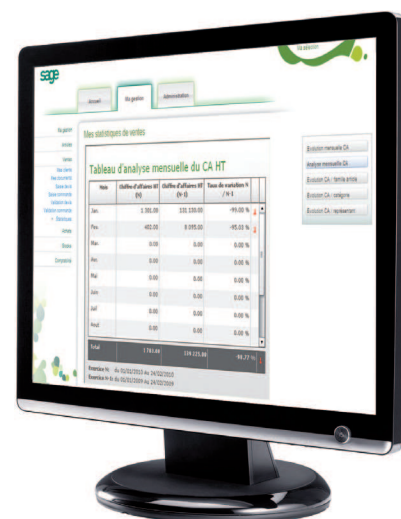
Accédez à votre espace de gestion personnalisé

Le ou les acheteurs - en déplacement ou à partir de leur bureau - peuvent saisir une facture, comparer les tarifs fournisseurs pour mieux les négocier et consulter le catalogue article très facilement afin de lancer un réapprovisionnement en cas d'urgence.