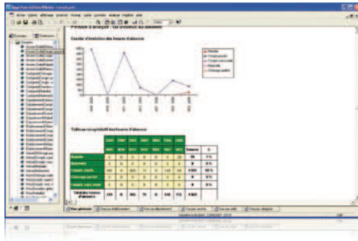
Tableau de bord 1